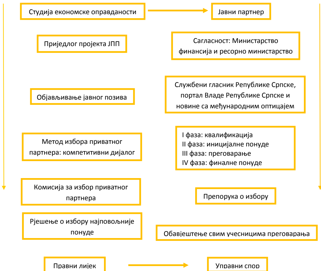
Слика 4. Процедура избора приватног партнера