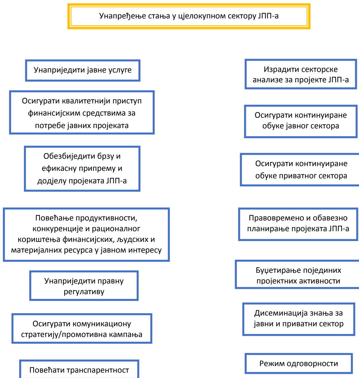
Слика 2. Дрво циљева