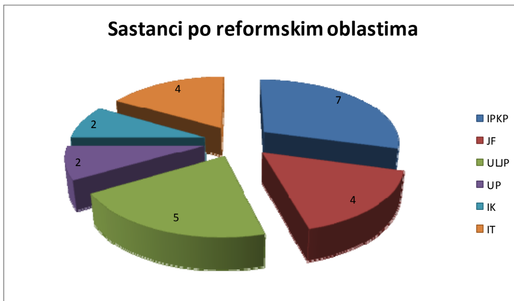
Grafikon 1: Sastanci nadzornih timova po reformskim oblastima

U oblasti Izrada politika i koordinacijski kapaciteti održano je ukupno sedam sastanaka (u ovoj oblasti postoje dva nadzorna tima). U oblasti Upravljanje ljudskim potencijalima održano je pet sastanaka, dok su u oblastima Javne finansije i Informacione tehnologije održana po četiri sastanka. Po dva sastanka nadzornog tima održana su u oblastima Upravni postupak i Institucionalna komunikacija. Broj sastanaka nadzornih timova po oblastima dat jena grafikonu 1.